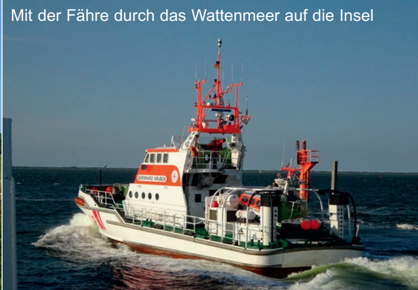
Mit der Fähre durch das Wattenmeer auf die Insel