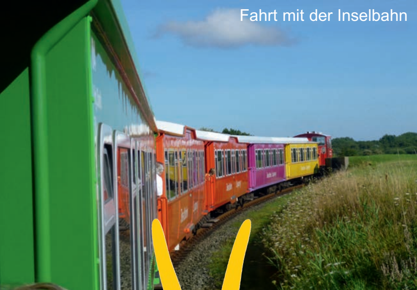
Fahrt mit der Inselbahn